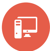
顺控操作实时逻辑验证